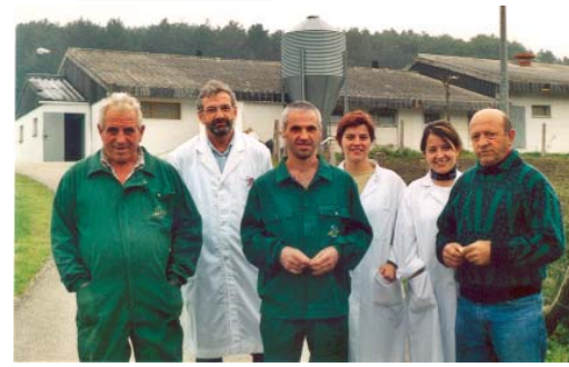
Personal del Centro de Inseminación de Oskotz.