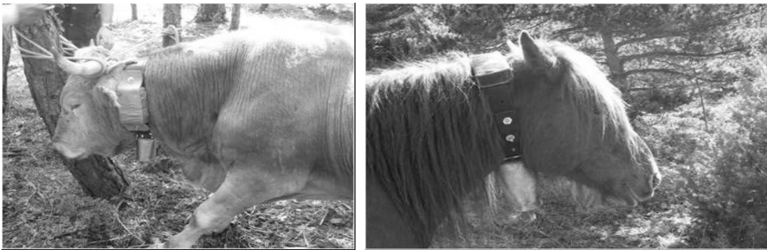
Figura 1. Equipos de seguimiento en el toro Betizu y en la yegua Burguete.

Key words: GPS-GSM, localization, grazing, mares, Betizu